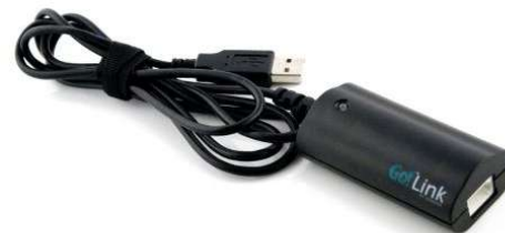
Einkanaliges Interface Go!Link